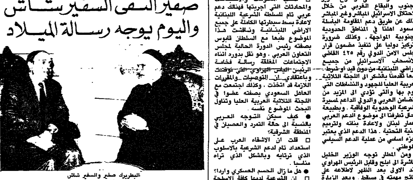
صفيار تقى السفير شاش